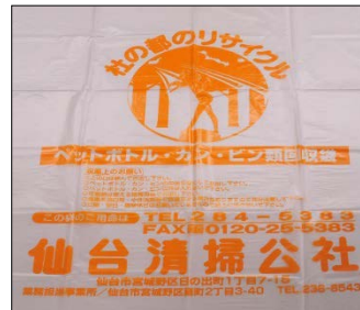
【ペットボトル・カン・ビン】